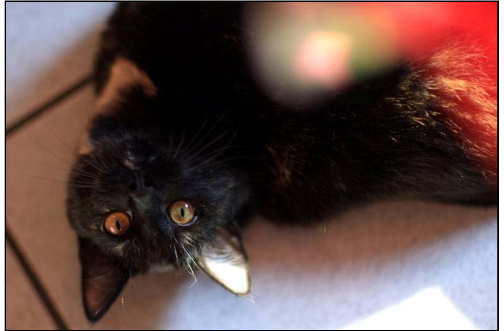
Peppi, immer auf Zack