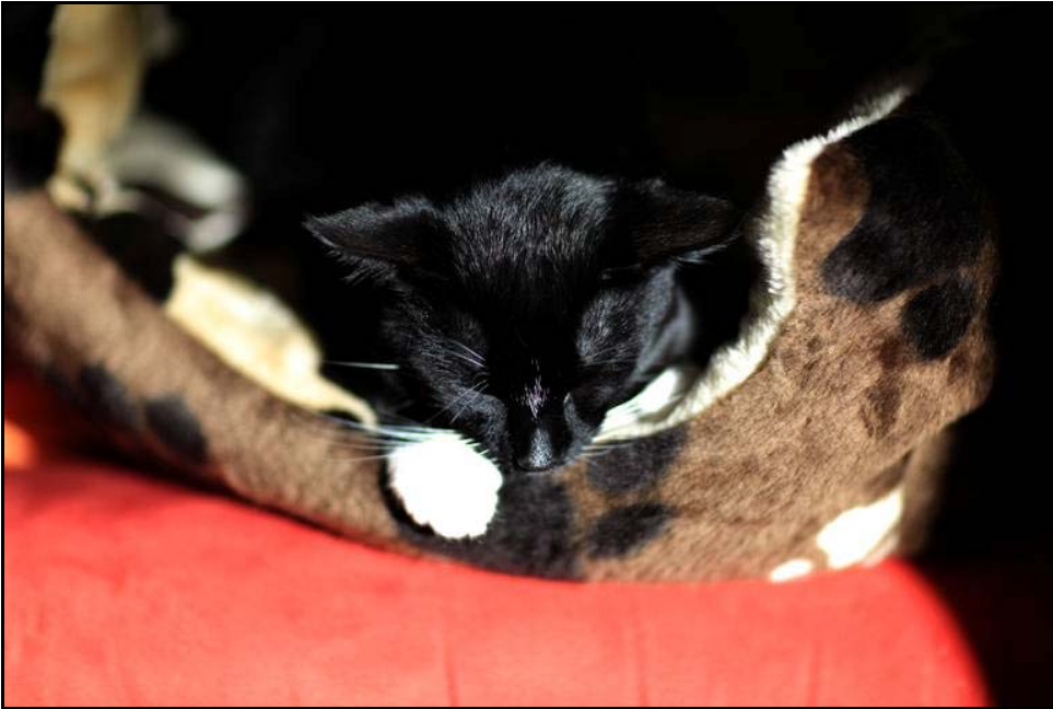
Wally nach seiner Entmannung