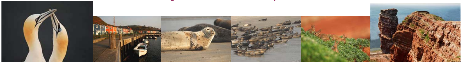
Alle Fotos entstanden im Mai 2006 auf dem letzten Helgoland-Workshop